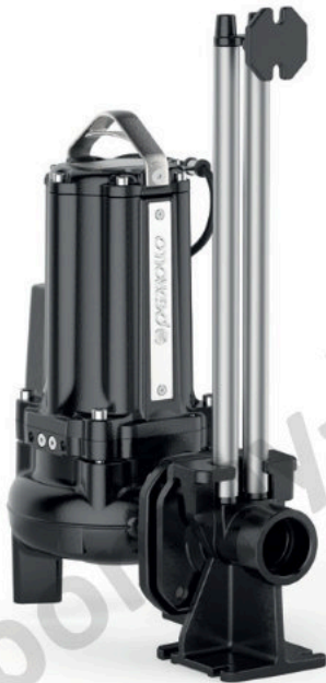
Pozioma stopa montażowa